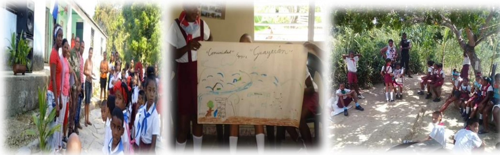
Figura 2: Actividades con escolares. Figure 2: Activities with schoolchildren.