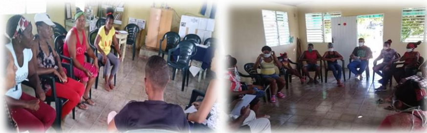
Figura 2: Actividades con actores comunitarios. Figure 2: Activities with community actors.