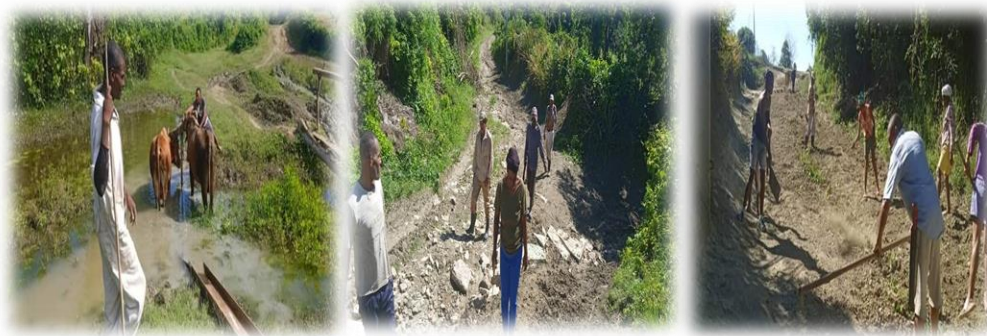
Figura 2: Actividades de saneamiento ambiental.

Sobre la concepción de la educación popular ambiental en la comunidad de Guayacán, la investigación manifiesta un camino de transformaciones profundas sobre formas de pensar y actuar a través del aumento de la concienciación que lleva implícito el fortalecimiento de individuos con capacidades instaladas para un proceso sistemático que aporta al desarrollo comunitario desde la dimensión ambiental conocimientos, habilidades, valores y actitudes que facilitan la identificación de sus problemas y la construcción colectiva de saberes sobre las realidades comunitarias y la búsqueda de alternativas para proporcionar mejoras en la calidad de vida de las personas. En las Figuras 1, 2 y 3 se observan evidencias de los momentos donde se realizaron las actividades medio ambientales.