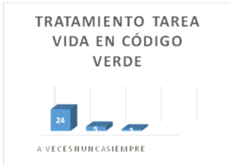
Fig. 4. Frecuencia del tratamiento de la Tarea Vida en la programación.

Al indagar sobre las acciones que contempla la Tarea Vida para el enfrentamiento al cambio climático fue posible constatar que los profesionales no dominan suficiente información sobre la pertinencia del Plan de Estado y el contenido que lo conforma.