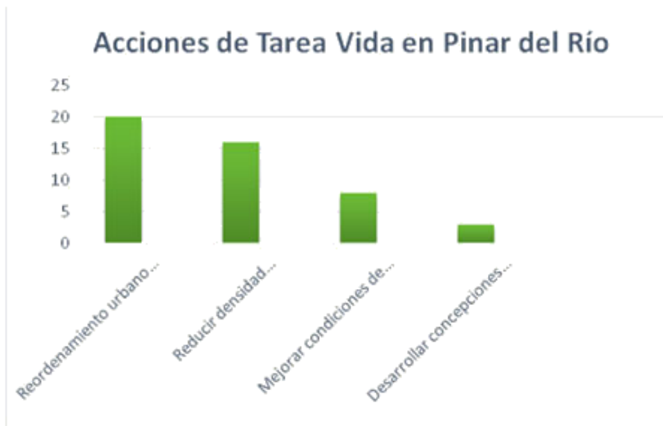
Fig. 5. Nivel de conocimiento sobre las acciones de la Tarea Vida en la provincia.

Tras obtener la información a través de la aplicación de los métodos y técnicas de investigación, la triangulación metodológica se hizo utilizando la realización del árbol de problemas como técnica para el análisis situacional. El presente estudio arrojó los siguientes problemas: 1) Falta de una adecuada educación ambiental de los profesionales del canal, dada por las pocas acciones de superación profesional sobre medioambiente. 2) Ausencia de la Tarea Vida en la agenda mediática que tiene su base a partir de la planificación a corto plazo de los temas a tratar en el programa. 3) Escasa divulgación de la Tarea Vida en el programa Código verde. 4) Disminución de la percepción de riesgo sobre el cambio climático en las audiencias, al predominar el abordaje irregular de los problemas ambientales en el espacio televisivo y el desconocimiento de las acciones estratégicas de la Tarea Vida.