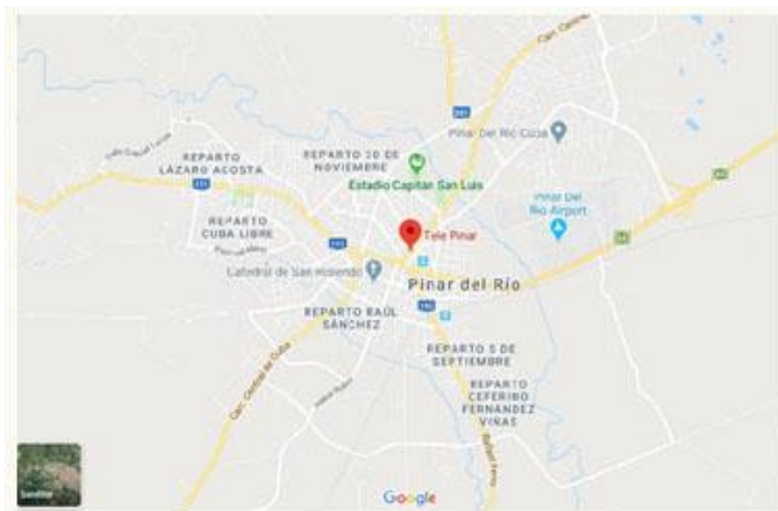
Figura 1. Ubicación geográfica del telecentro provincial Tele Pinar en la ciudad de Pinar del Río.

Por el norte limita con la calle Isabel Rubio, al sur la calle Colón, al este Juan Gualberto Gómez y al oeste Adela Azcuy, en la provincia de Pinar del Río.