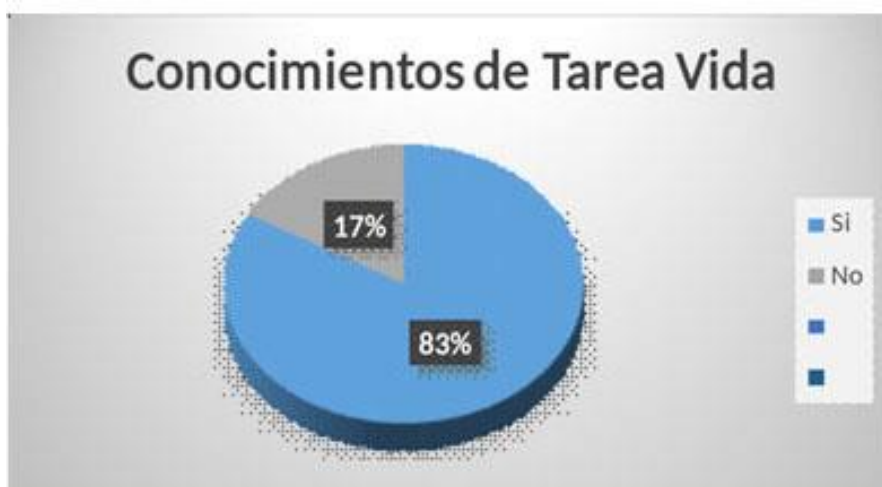
Fig. 3. Grado de conocimiento de la Tarea Vida.

Al indagar en la identificación del objetivo y familiarización de los encuestados con la Tarea Vida el 83% (25) aclaró dominar el significado y acotaron que se planteó a partir de la necesidad de cuidar el medio ambiente y cómo cada una de las instituciones y los diferentes sectores de la sociedad desde su quehacer cotidiano, se pueden unir en este objetivo. Por su parte el 17 % (5) de los encuestados alegaron desconocer de qué se trata la Tarea Vida y su propósito en el país ( Figura 3 ).