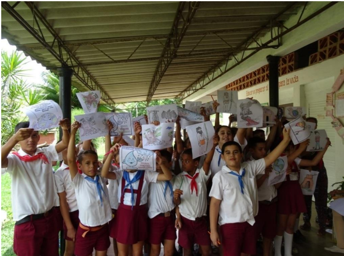
Figura 3. Taller etnográfico niños de la escuela primaria Juan Clemente Zenea. Comunidad El Moncada. Municipio Viñales.

En lo que concierne a otras actividades educativas en el trabajo de campo se mostraron videos animados relacionados con la diversidad cultural y la biodiversidad. Estos generaron espacios de diálogos y relaciones sociales destinadas a la estimulación, comprensión, tolerancia, respeto, pertenencia e identidad. Son acciones transformadoras que permiten crear conocimientos y convertir los saberes en aprendizajes haciendo partícipe a los diversos actores sociales. Tiene como objetivo promover valores para garantizar la preservación del patrimonio arqueológico, cultural y natural. Creando un reservorio de conocimientos presentes en las memorias de cada uno de los pobladores. Se revela, una serie de hechos que se han transmitido verbalmente evidenciando un significado más relevante al vincularse con la Arqueología y la Antropología Ambiental.